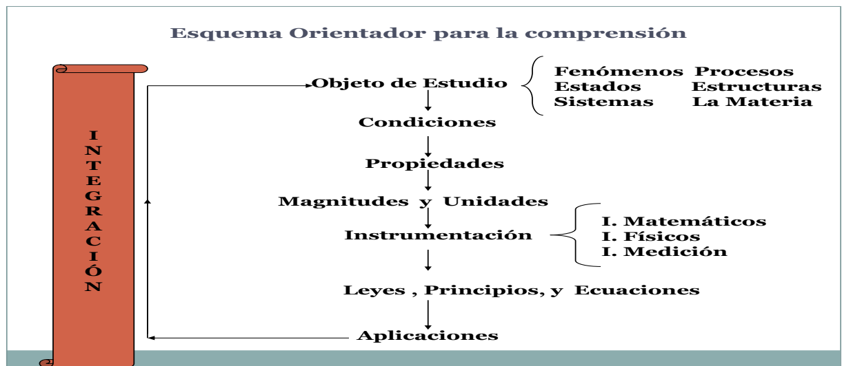
Figura1. Esquema Orientador para la comprensión.

El Esquema orientador que se muestra en la Figura 1 es el instrumento esencial y fundamental de la experiencia porque interrelaciona todas las invariantes del proceso de construcción y aprendizaje del conocimiento de la física: