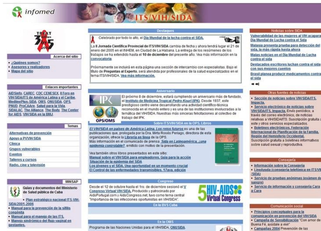
Figura 1. Sitio web ITS/VIH/sida tal y como se publicó en el 2004