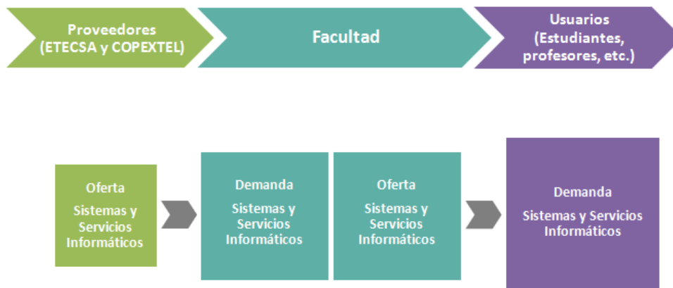
Fig.1- Representación gráfica de la situación límite de la Facultad.

Al analizar la relación permanente que se establece entre la Institución con los proveedores, se puede entrever que la oferta de sistemas y servicios informáticos por parte de los proveedores es mucho menor que la demanda generada por la Facultad. Al analizar la relación permanente que se establece entre la Institución con los usuarios, se puede constatar que los sistemas y servicios informáticos que ofrece la Facultad a sus usuarios es menor que la demanda generada por ellos. Luego el proceso administrativo tenderá a la investigación de la relación que se establece entre la Institución y los proveedores, ya que estos últimos constituyen el contrario deprimido, y dentro del cual se encuentra la restricción.