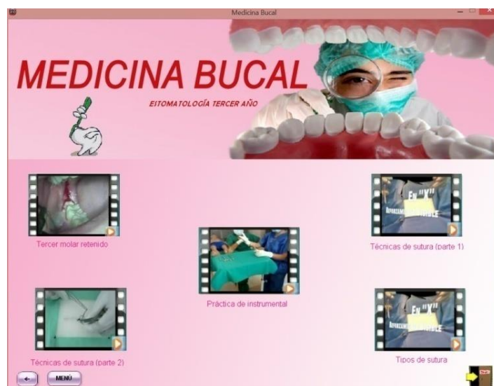
Fig. 4- Multimedia MEDICINA BUCAL. Módulo “Videos”

Los materiales de consulta como libros, folletos elaborados por especialistas y otros artículos, para profundizar en los conocimientos sobre el tema, se pueden encontrar en el módulo “materiales”, y además en el módulo “videos” se pueden visualizar una serie de ellos que muestran diferentes estructuras anatómicas y técnicas, fundamentalmente dirigidos a alumnos ayudantes de Cirugía Maxilofacial (Fig. 4), algunos de los cuales aparecen explicados en idioma inglés, teniendo en cuenta que constituye una de las estrategias curriculares de la carrera; y el módulo “ayuda” que brinda al usuario las características y el modo de utilizar la multimedia. En el borde inferior derecho aparece un ícono que permite la salida del sistema.