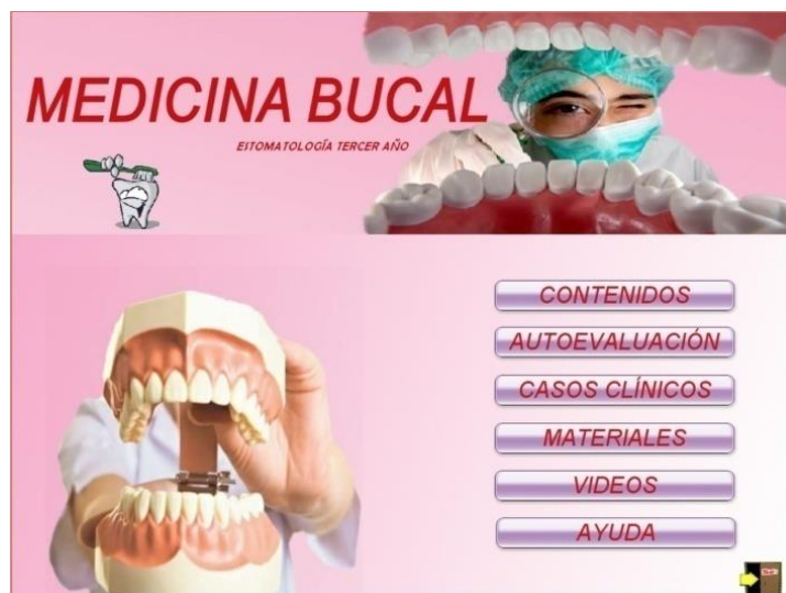
Fig. 1- Multimedia MEDICINA BUCAL. Página inicial

El módulo “contenidos” muestra lo relacionado a la asignatura mediante textos e imágenes, mientras que el de “casos clínicos” muestra una serie de casos recogidos por alumnos y profesores en las consultas externas durante la estancia de Medicina Bucal (Fig. 2).