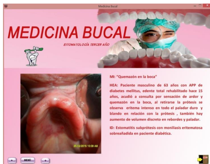
Fig. 2- Multimedia MEDICINA BUCAL. Módulo “Casos clínicos”

El módulo “contenidos” muestra lo relacionado a la asignatura mediante textos e imágenes, mientras que el de “casos clínicos” muestra una serie de casos recogidos por alumnos y profesores en las consultas externas durante la estancia de Medicina Bucal (Fig. 2).