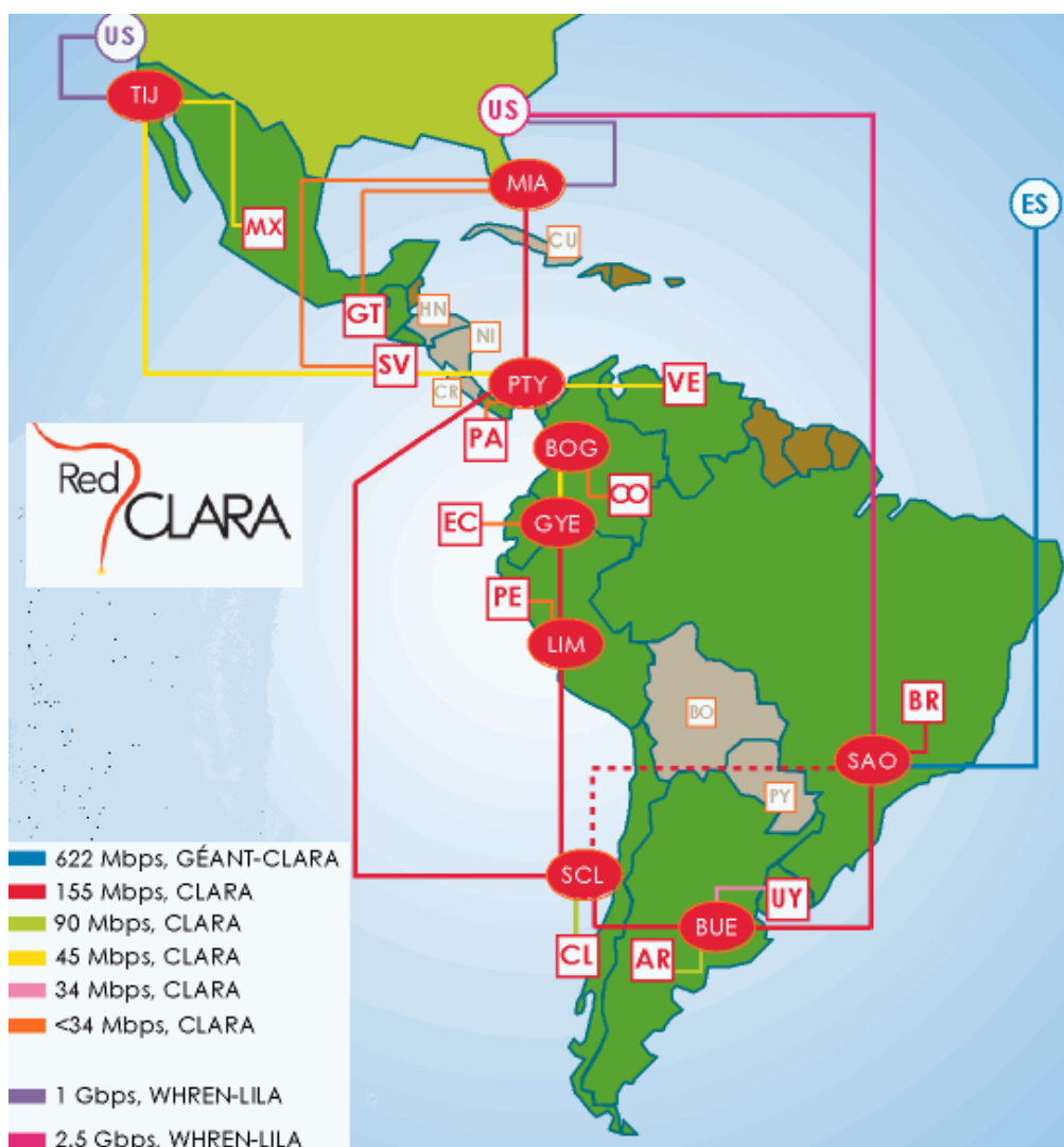
Fig. 1- Red CLARA

Es una corporación sin fines de lucro que desarrolla aplicaciones y tecnologías de redes académicas avanzadas para apoyar el desarrollo de la investigación, la innovación y la educación en América Latina. En cuanto a infraestructura, es una red telemática desarrollada por y para las Redes Nacionales de Investigación y Educación del área.