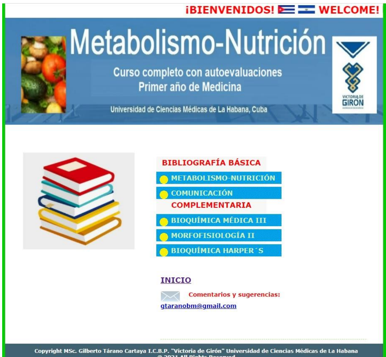
Fig. 3- Opción del menú correspondiente a la Biblioteca.

(Fig. 3) que contiene el libro de texto de la asignatura y materiales complementarios, que incluyen otro libro completo y partes de otros dos tomos del antiguo libro de texto.