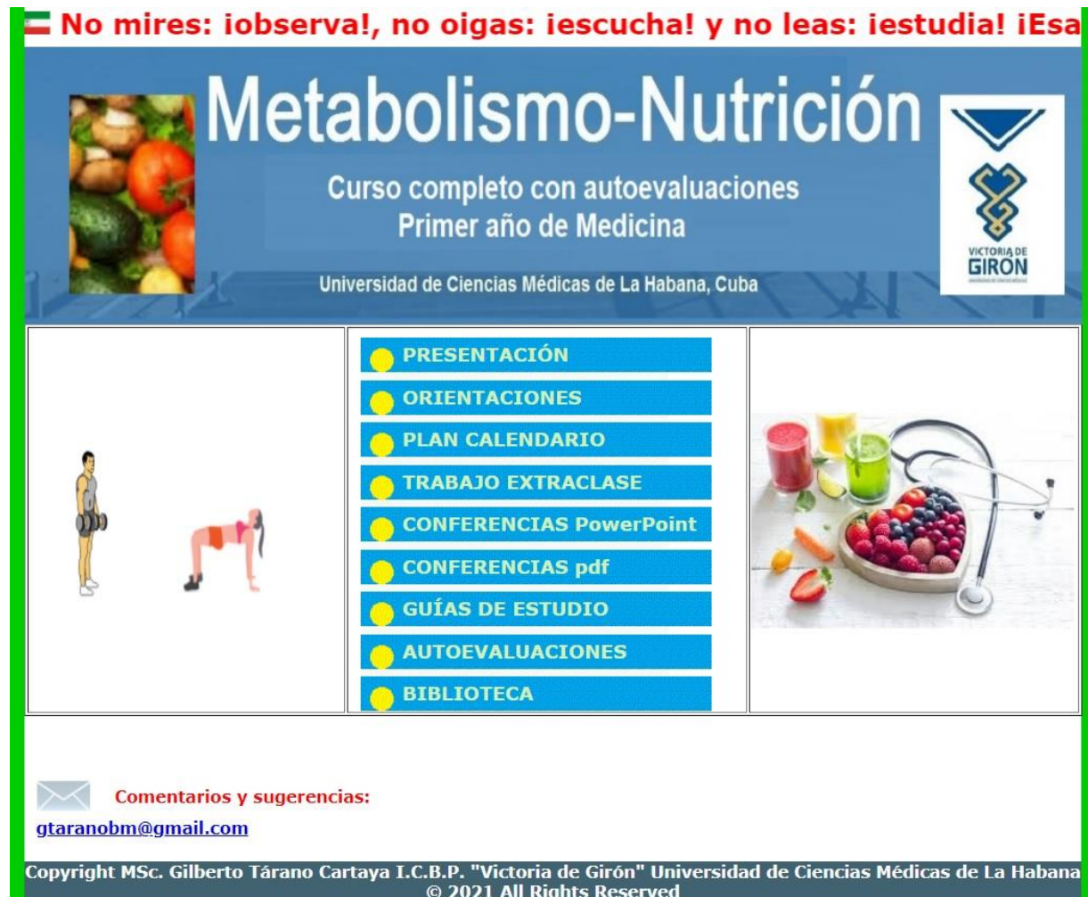
Fig.1- Página delantera del software educativo de Metabolismo-Nutrición para la enseñanza y aprendizaje del primer año de la carrera de medicina.

La primera opción del menú denominada “Presentación” ofrece detalles del software, autores y agradecimientos. La segunda opción del menú denominada “Orientaciones” le ofrece las indicaciones generales para el estudio de la asignatura en un formato PDF. La opción Plan calendario muestra el orden de las actividades docentes, que consisten en Conferencias orientadoras y Clases taller evaluadas. A continuación, se presenta la opción Trabajo extraclase, que muestra al acceder al mismo todas indicaciones y documentos para realizar un informe escrito, que ha de entregarse a su profesor (Fig. 2). Le siguen nueve conferencias que se ofertan en dos formatos: PowerPoint y PDF, el primero para que de una forma animada puedan tener una visión global de los contenidos de la conferencia y las de formato PDF para poder leer los