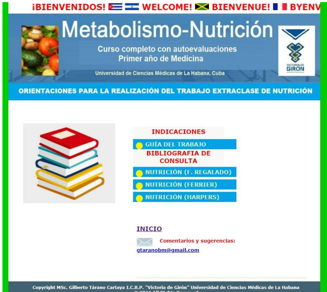
Fig. 2- Orientaciones para el trabajo extraclase de Nutrición y tres bibliografías que deben consultar.

pies de páginas de cada una de las diapositivas, que contienen una explicación auxiliar para su comprensión. Ambas opciones tienen la misma apariencia en el menú de la página delantera. La opción de las Guías de estudio, contiene doce guías con sus objetivos, indicaciones del estudio individual, con preguntas para responder y discutir en las Clases taller.