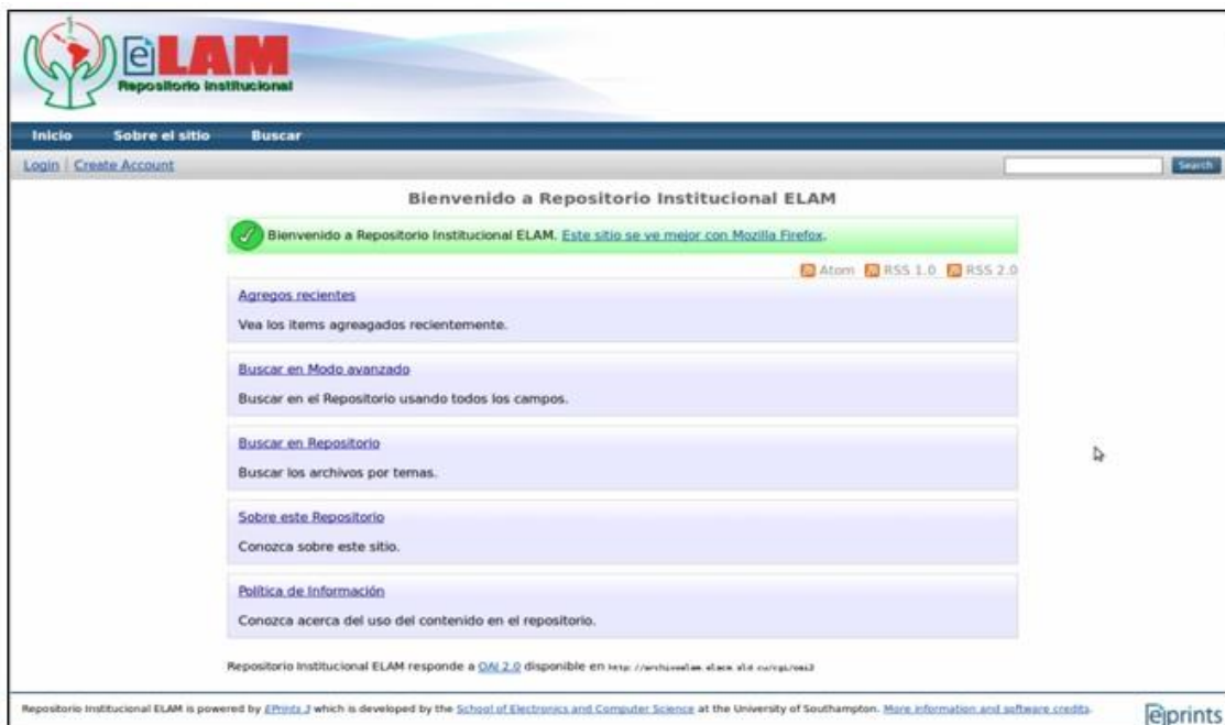
Fig. 1. Página inicial del Repositorio Institucional

En el pie de la página aparece el enlace "OAI2.0" a la página que describe los principios sobre los que se basa el uso del servicio, así como al sitio del Proyecto EPRINTS, la Escuela de Electrónica y Ciencias de la Computación de la Universidad de Southampton y los créditos de la aplicación (Fig. 1).