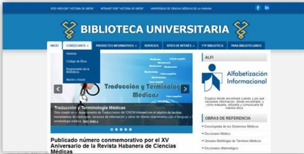
Figura 1: Página de inicio y menú principal