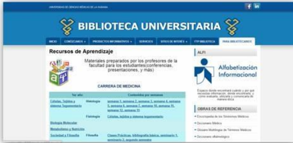
Figura 4: Página de Recursos de aprendizaje