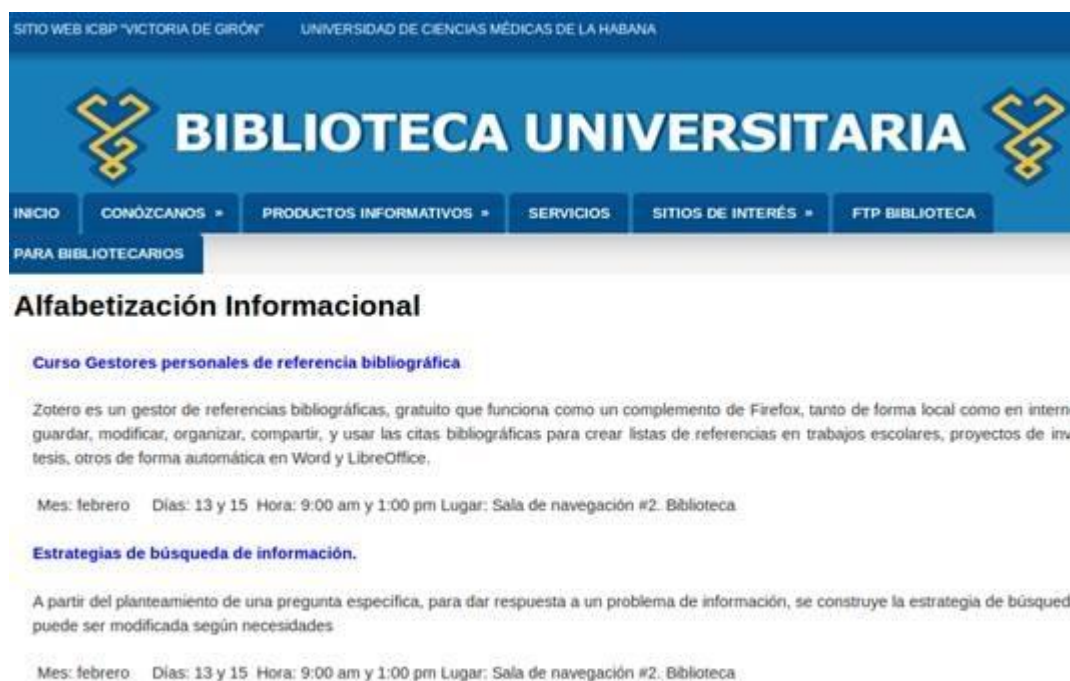
Figura 3: Página de Alfabetización informacional

Además se ofrecen cursos de autoformación en el aula virtual del centro a través de la plataforma de aprendizaje en línea moodle.