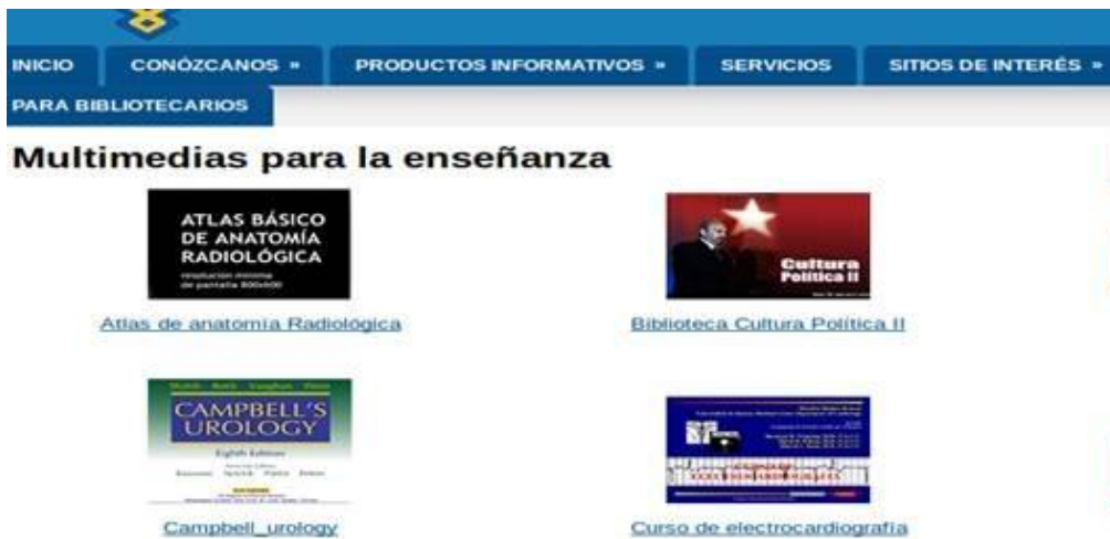
Figura 5: Página para la descarga de las multimedias para la enseñanza