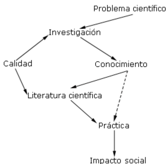
Fig. 1. Problema científico, calidad de la investigación e impacto social.

estas, los artículos originales son los que dan cuenta de los resultados obtenidos en la búsqueda de respuestas a preguntas de investigación concretas.