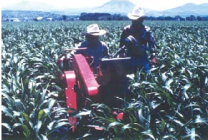
FIGURA 4. Motocultor alto despeje. Fuente Lara (2000).

cultor encontró que para el sector de subsistencia la potencia óptima del promedio de tamaño de propiedades (8 ha) es de 5,16 kW (6,91 hp).