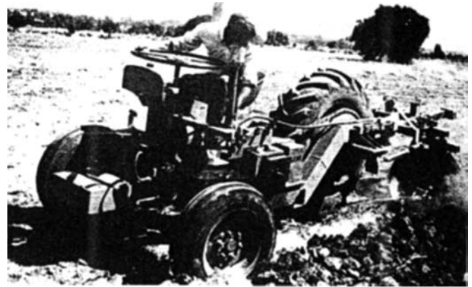
FIGURA 2. Tractor trineumático fuente Betancourt 2002.

La característica esencial de este tractor en comparación a otros tractores es su precio mucho más bajo comparado con los existentes en el mercado tradicionalmente, el número reducido de sus componentes, hacen que los gastos de mantenimiento sean bajos, por ello el tractor se muestra apropiado para ejecutar los trabajos agrícolas básicos en propiedades pequeñas de campesinos pobres (Díaz, 1976). Se muestra en la Figura 2. El tractor se proyectó para usar dos tipos de motores (diesel y gasolina), y en ambos casos la potencia es de 18 hp. La superficie que hace productiva la adquisición de un tractor es de 7 ha en sistemas agrícolas bajo riego y de 14 ha. En superficies bajo sistema de cultivo de temporal (Díaz 1976).