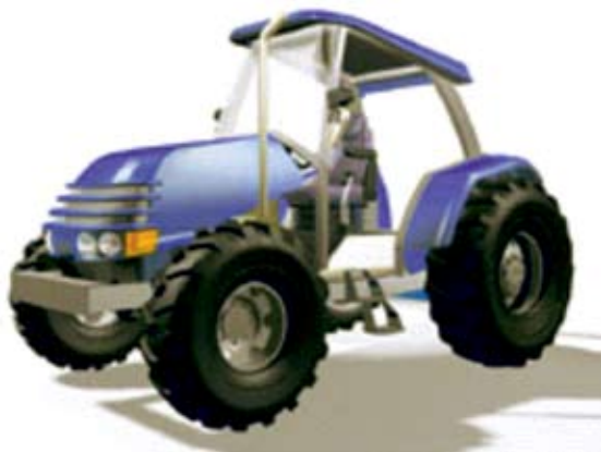
FIGURA 3. Tractor vehículo de trabajo. Fuente Correa (2002).

Una vez definidas las modificaciones mecánicas al tren de fuerza, para lo cual se contó con asesoría en ingeniería, se definieron los componentes a diseñar: carrocería y cabina.