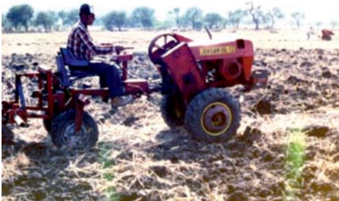
FIGURA 5. Motocultor alto despeje vista lateral.