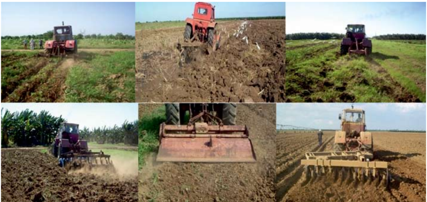
FIGURA 1. Conjuntos utilizados en las tecnologías de laboreo.