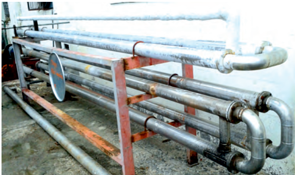
FIGURE 2. Heat exchanger assembled and mounted in the factory. FIGURA 2. Intercambiador de calor ensamblado y montado en la fábrica.

Cool fluid to be heated is an organic liquid with 96% of water and 4% of solvable and unsolvable solids. For that reason, it was assumed that this fluid could be treated as water. Hot fluid is saturated vapor to 120°C of temperature and absolute pressure of 2 kg/cm 2 . The mass flow of cool fluid is 1,331 kg/s. In Figure 3 the fluids disposition is shown, which, in this case, is cross-flow.