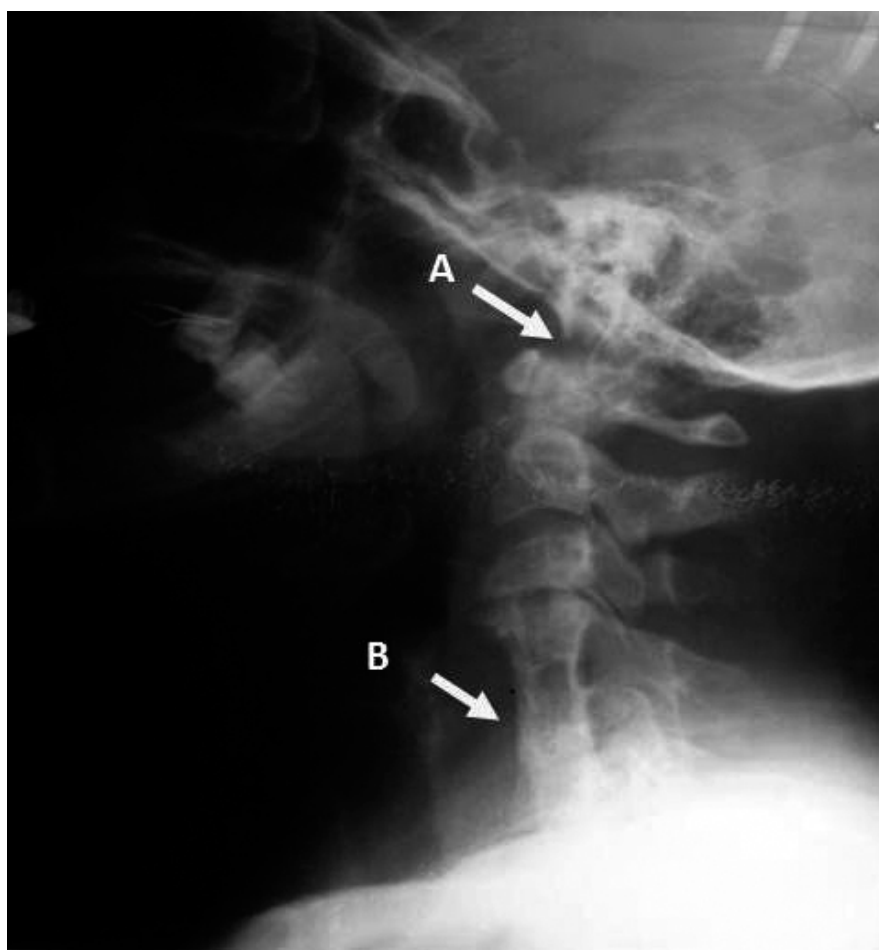
Figura 1. Rayo X de columna cervical con múltiples alteraciones radiológicas.