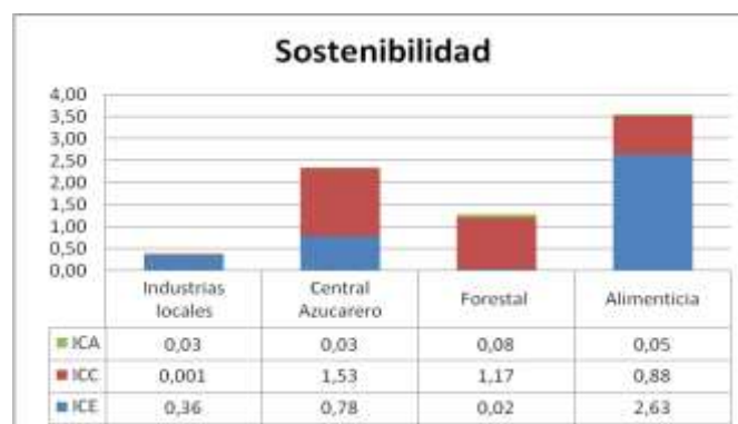
Fig. 4. Dimensión ambiental, indicador sostenibilidad

Para la dimensión ambiental se analizó el indicador sostenibilidad desde tres variables, como se refleja en la figura 4. Si se tiene en cuenta que menor valor representa menor apoyo en los consumos de agua, combustible y electricidad para generar ingresos, Industrias Locales presentó mayor ventaja. La dimensión apunta al uso racional de los recursos contaminantes (combustible y electricidad) y agotables (agua).