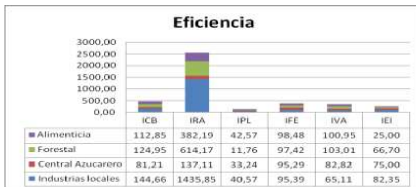
Fig. 2. Dimensión económica, indicador eficiencia

Una valoración de la dimensión económica, desde sus dos indicadores en términos absolutos, presentó a la Alimenticia como la más estable en su gestión, seguida por la Forestal. Los resultados contribuyeron a fortalecer el diagnóstico territorial para encauzar procesos de desarrollo local. El aprovechamiento de la capacidad motriz de un organismo sobre otro se podrá fundamentar en las variables que se quieran potenciar a través de la formulación de proyectos de desarrollo.