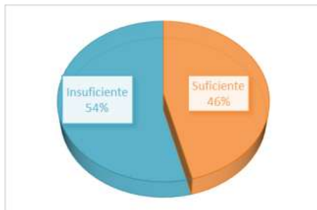
Figura 2. Participación familiar en la escuela.

Los resultados obtenidos en este aspecto se asemejan a los de Álvarez et al. (2010) y Calvo et al. (2016) cuando mencionan que en muchas ocasiones la participación de las familias en los Comités de Padres de Familia es menor de lo que se pretendía, siendo habitual que sean siempre los mismos padres quienes representan a todos y los que acuden a las actividades propuestas. Por lo que no se logra involucrar de un modo efectivo a las familias en las estructuras de participación, siendo la participación más formal que real. Este sería un importante aspecto para mejorar, teniendo en cuenta que las familias y el personal docente deben establecerse como «socios igualitarios en las decisiones que afectan a los niños y sus familias, y juntos informan, influyen y crean políticas, prácticas y programas» (Asociación de Padres y Maestros, 2015, p. 7). Por lo tanto la participación de la familia es necesaria y debe ser valorada.