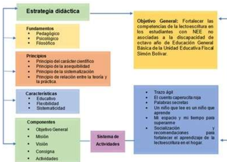
Figura 1. Representación gráfica de la estrategia didáctica.

Estas competencias lectoras permitirán a los estudiantes contar con la capacidad de obtener diferentes conocimientos, habilidades, pensamientos, carácter y valores de manera integral en las distintas interacciones que tienen en sus vidas en los ámbitos personal, social y en un futuro en lo laboral. En la Figura 1 se puede observar la representación gráfica de la estrategia didáctica.