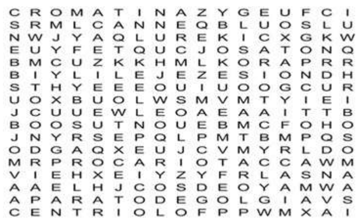
Figura 1. Sopa de letras.

Etapa de evaluación: se evaluará de acuerdo a la cantidad de palabras encontradas, considerando el tiempo y tomando en cuenta las dificultades que puedan presentar. (Figura 1)