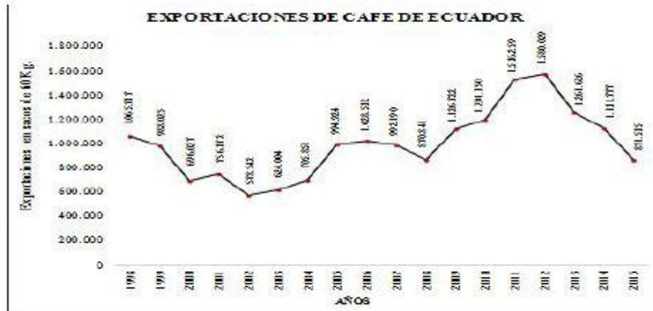
FIGURA 2. EVOLUCIÓN DE LAS EXPORTACIONES DE CAFÉ DE ECUADOR, PERÍODO 1998 -2016.