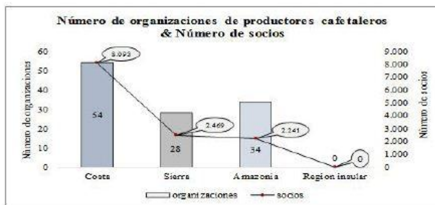
FIGURA. 5 NÚMERO DE ORGANIZACIONES DE PRODUCTORES CAFETALEROS - NÚMERO DE SOCIOS

Según datos (COFENAC, 2012), se estima que apenas un 10 % de caficultores se encuentran organizados, el número de organizaciones de productores cafetaleros y el número de socios por región, muestra la siguiente información, siendo la zona costera la que presenta los valores más elevados debido a que es el área donde se han identificado las mayores extensiones de tierras destinadas al cultivo de café (Fig. 5).