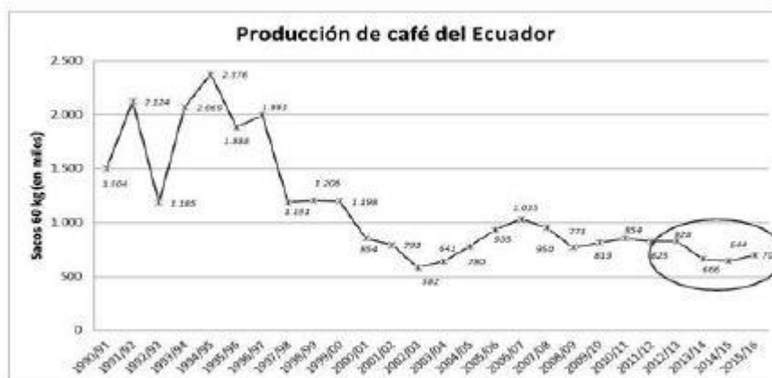
FIGURA 4. PRODUCCIÓN DE CAFÉ DE ECUADOR, PERÍODO: 1990/1991 – 2015/2016

De acuerdo a datos oficiales del MAGAP (2016) se han renovado 70.000 hectáreas de Coffeasp , beneficiando a 48.000 productores, de las cuales se han sembrado 20.000 hectáreas en Manabí. Sin embargo, los resultados del MAGAP, aún no son visibles, toda vez que la curva de producción lejos de incrementarse se ha reducido drásticamente, tal como se observa en la Figura 4.