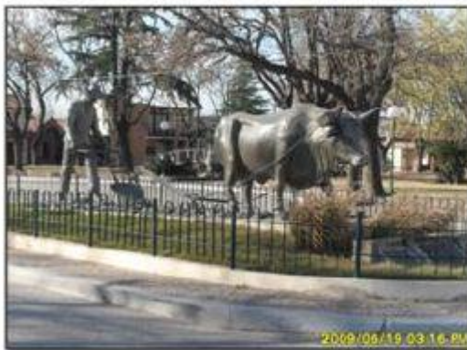
FOTOGRAFÍA 3: ESCULTURA EN LA CIUDAD DE ARMSTRONG, DEPARTAMENTO BELGRANO, SANTA FE

En el recorrido por las localidades también se pueden encontrar monumentos que acompañan a construir identidad, constituyen aspectos que tienden a naturalizar la idea del pasado y del presente con las peculiaridades de la producción y el trabajo vinculado a la industria, evidenciando la capacidad de los grupos humanos de recrear espacios de sociabilidad recuperando las singularidades que se le otorga al pasado. Para ejemplificar se puede observar que, en Armstrong, en una de las avenidas principales, se encuentra la estatua del agricultor, con el rudimentario arado de tracción a sangre, representando el laboreo de la tierra y con la tecnología de época (ver fotografía 3). En el caso de Las Parejas se puede encontrar el monumento al obrero metalmeccánico como símbolo del trabajador industrial (ver fotografía 4).