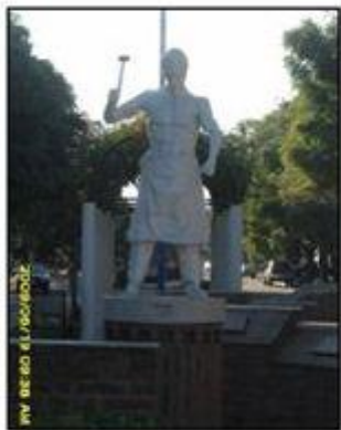
FOTOGRAFÍA 4: MONUMENTO EN LA CIUDAD DE LAS PAREJAS, DEPARTAMENTO BELGRANO, SANTA FE