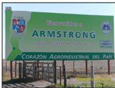
FOTOGRAFÍA 2. SLOGAN EN LA ENTRADA A LA CIUDAD DE ARMSTRONG, DEPARTAMENTO BELGRANO, SANTA FE