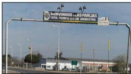
FOTOGRAFÍA 1. SLOGAN EN LA ENTRADA A LA CIUDAD DE LAS PAREJAS, DEPARTAMENTO BELGRANO, SANTA FE

Santa Fe la designa como “ Capital de la Pyme agroindustrial ”, por Ley Provincial N° 12.335 del 13 de octubre de 2004 (ver fotografía 1). En tanto que la localidad de Armstrong se autodenomina como el “ Brazo fuerte de Santa Fe, corazón agroindustrial del País ” (ver fotografía 2). El mote de brazo fuerte, hace referencia a la traducción del nombre de la localidad del inglés al castellano.