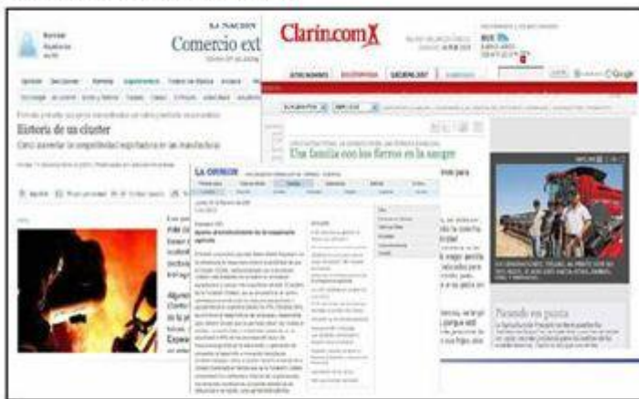
FIGURA 1. EL CLUSTER EN LOS PERIÓDICOS PROVINCIALES, REGIONALES Y NACIONALES