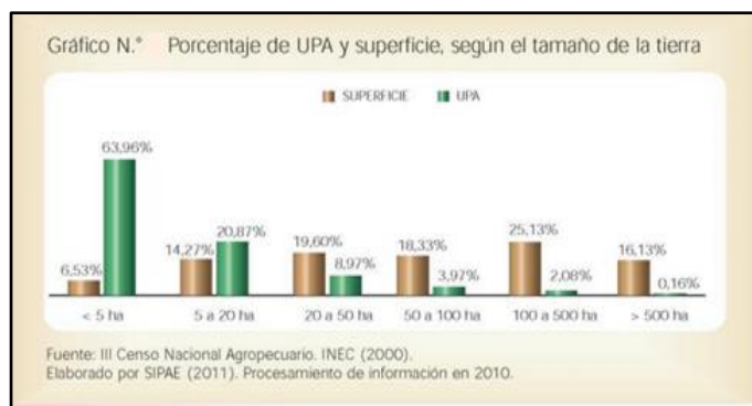
Grafico 1. Porcentaje UPA por superficie