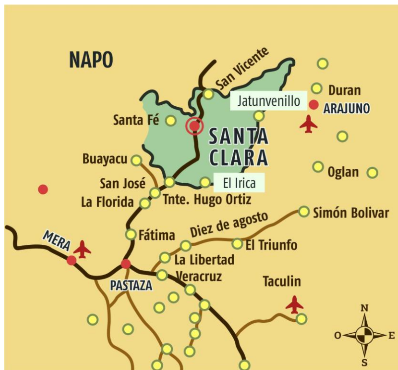
Figura 1. Ubicación de la parroquia rural San José.

corresponden 69 km 2 a la parroquia), a 21 km del cantón Pastaza y a 12 km del cantón Santa Clara (Figura 1).