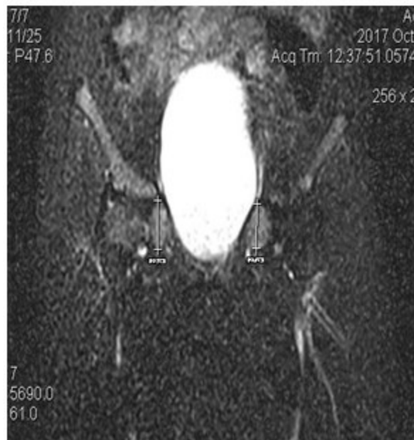
Figura 2. RMN de pelvis. Presencia de testes en ambos canales inguinales

Se observó ausencia de útero y anejos. Permeabilidad a nivel de los genitales externos,