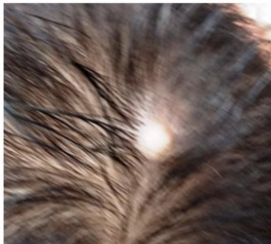
Figura 6. Recién nacido 15 días con ACC