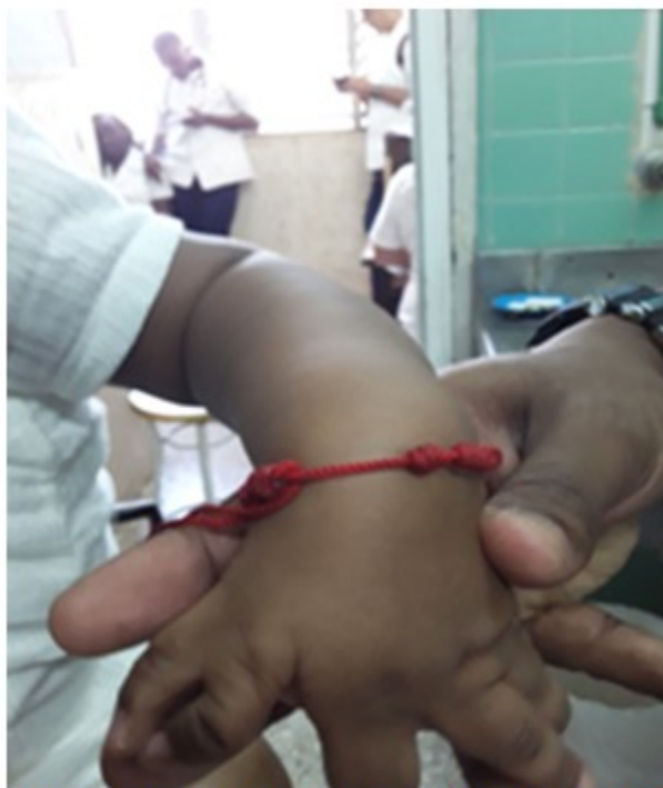
Figura 2. Presencia de polidactilia en la mano izquierda