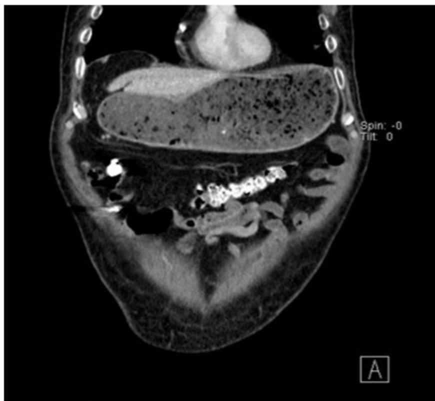
Fig. 1. Tomografía axial computarizada abdominal con contraste vía oral en corte coronal

De forma inicial, se realizó búsqueda intencionada de patología quirúrgica abdominal por lo que se solicitó la realización de tomografía abdominal contrastada, que reportó estómago a máxima repleción de contenido gastro-alimentario, unión gastroduodenal con engrosamiento circunscrito de su pared y aumento del diámetro de la primera y segunda porción del duodeno. (Fig. 1).