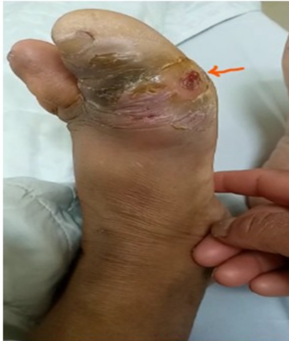
Fig. 1. Estado del artejo grueso, con lesión ulcerada, tumefacción, cambios de coloración y estado descamativo de la piel

continuaba en dirección medial y afloraba en la superficie de la piel a nivel del espacio interdigital entre el primer y segundo dedos. (Fig. 1).