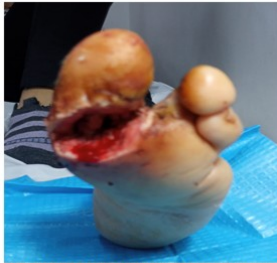
Fig. 2. Estado del artejo luego de realizar necrectomía hasta retirar todo el tejido desvitalizado

Se obtuvieron muestras de sangre de la paciente, que se procesaron en condiciones de extrema asepsia mediante centrifugación para obtener el PRP.