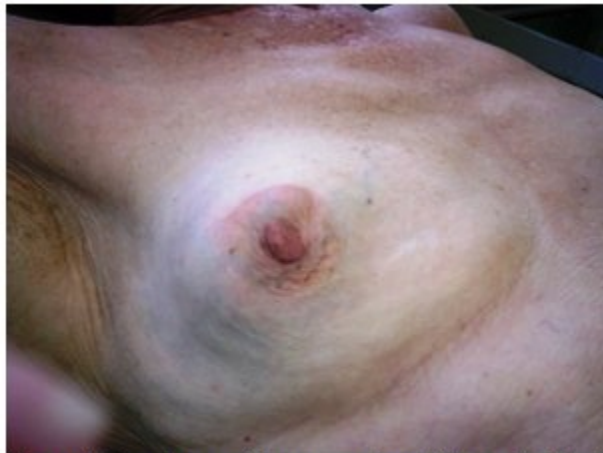
Figura 1. Gran tumoración que ocupaba prácticamente toda la mama derecha

Esta tumoración no estaba adherida a planos superficiales ni profundos, ni se acompañaba de adenopatías axilares. (Figura 2).