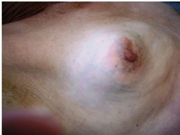
Figura 2. Vista que permitió visualizar la axila libre

Esta tumoración no estaba adherida a planos superficiales ni profundos, ni se acompañaba de adenopatías axilares. (Figura 2).