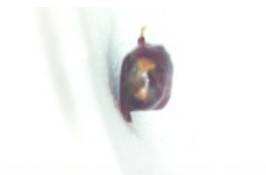
Figura 2. Se observa lesión de bordes bien definidos encapsulada de color negro

Técnica quirúrgica: con el paciente colocado en posición de plegaria mahometana modificada, se realizó asepsia y antisepsia, se colocaron paños estériles. Se planeó una incisión dorsal media desde D12 a L4, que se delimitó con comprobación radiológica y se procedió a incisión definitiva, se practicó desinserción de la musculatura paravertebral de manera estándar y se efectuó esqueletización y laminectomía del arco vertebral de L2. Se ejecutó durotomía y se visualizó una lesión que guardaba relación con raíces nerviosas a ese nivel, encapsulada, de color negro, se procedió con rizotomía, cauterizando en ambos extremos de la raíz y se realizó exéresis total de la lesión. Se realizó cierre dural, cierre por planos y se colocó drenaje de la herida. En el acto quirúrgico se siguieron todos los protocolos establecidos para la cirugía de pacientes con diagnóstico de VIH. Se envió la muestra a anatomía patológica para que fuera analizada. (Figura 2).