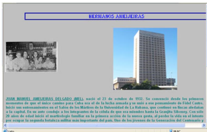
Figura 5. Fotos de los Hermanos Ameijeiras Delgado y del hospital que lleva su nombre.