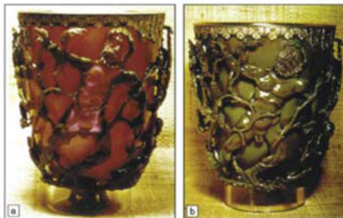
Figura 1. Vaso de Lycurgus. 8