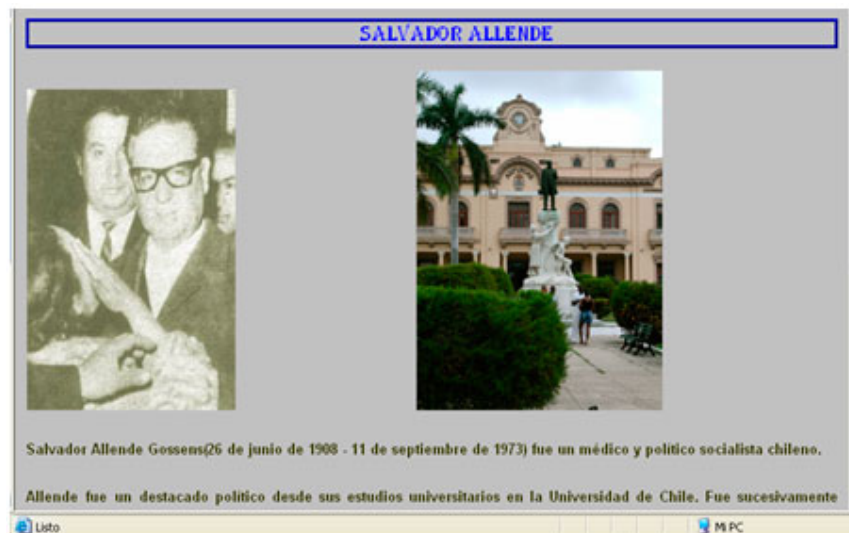
Figura 3. Salvador Guillermo Allende Gossens.

Muere en combate, el sábado 5 de octubre de 1974. El lunes 7 de octubre a las 7 de la mañana se efectuó lo que se pudiera llamar el funeral de Miguel Humberto Enríquez Espinosa. El día 6 de octubre le habían entregado el cadáver a la familia.