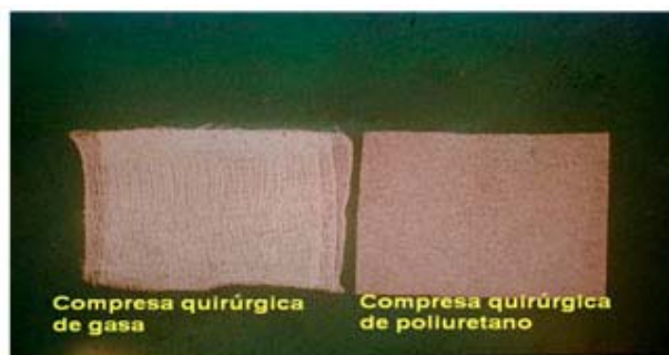
Fig 7. La esponja de poliuretano como sustituto de la gasa quirúrgica.

Ya en 1978, se realizan estudios e investigaciones con la esponja de Poliuretano, trabajo que fuera presentado en la Sesión Científica de la Sociedad Cubana de Cirugía con el título: " La esponja de Poliuretano como sustituto de la gasa en cirugía. Estudio económico, experimental y clínico". Al respecto se publica un reportaje en la Revista Química con el nuevo uso de la esponja en cirugía. Paralelo a esto, se investiga sobre el uso del peritoneo parietal como material autólogo en la confección de prótesis vasculares.