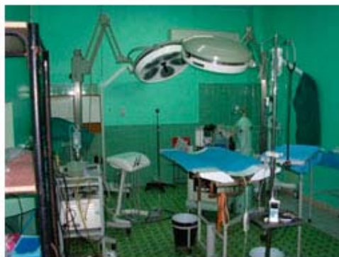
Fig 15. Quirófano del CENCEX después de su remodelación.

En ese año, por interés en realizar sus trabajos de doctorado por parte de especialistas italianos en Estomatología, se decide desarrollar un megaproyecto en nuestro Centro auspiciado por un contrato firmado con Cuba por 5 años, que involucró a otras instituciones del país. Para ello en su primera etapa se decide remodelar y reparar el Centro, así como las perreras del bioterio de la Facultad.