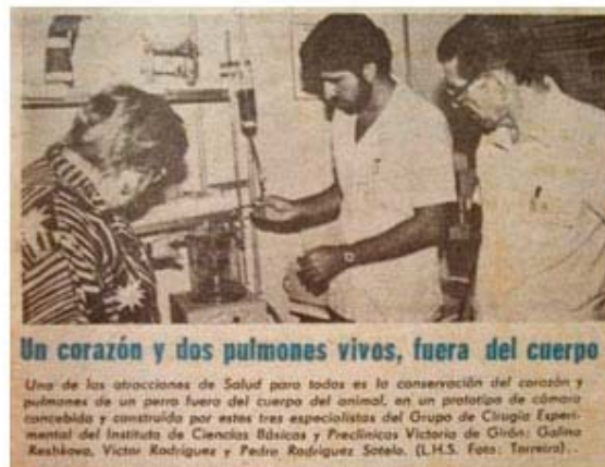
Fig 14. Reporte periodístico de la exhibición de la cámara de conservación del bloque corazón-pulmones aislados.