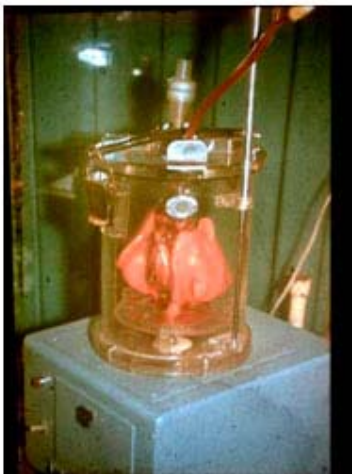
Fig 13. Cámara de conservación del bloque corazón-pulmones aislados. Feria Internacional "Salud para Todos", 1989.