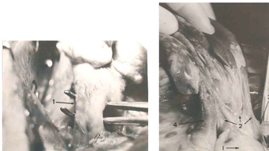
Fig 4 y 5. Autotrasplante experimental de pulmón en el perro.