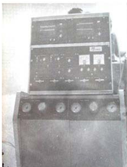
Fig 11. CORAMEC (Corazón Mecánico Cubano) de fabricación cubana.