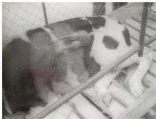
Fig 10. Ternero con el primer corazón mecánico.