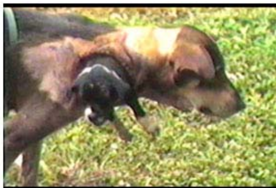
Fig 8. Trasplante de cabeza.