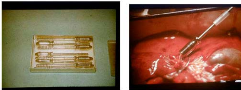
Fig 6. Cánulas de perfusión autoestática para trasplante de órganos.