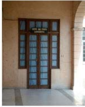
Fig 1. Oficina del Centro de Cirugía Experimental