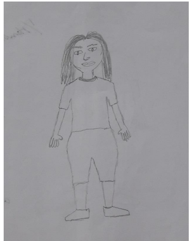
Figura 3. Test de Machover (Figura femenina)