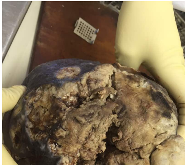
Fig. 1. Tumoración gigante de mama izquierda con necrosis y ulceración.

Macroscópicamente, se recibió mama izquierda sustituida por una masa tumoral ulcerada (Figura 1) que midió 32x20x10 cm (6,5 kg de peso), con aspecto fibroso de color gris blanquecino, semejante sarcoma con áreas enquistadas gelatinosas. Al corte, la superficie fue mucoide, con áreas de hemorragias carnosas y con quistes que se alternaron con zonas fibrosas (Figura 2).