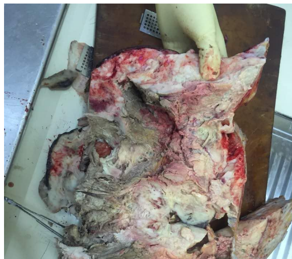
Fig. 2. Corte de sección de tumoración de mama con áreas de hemorragia.