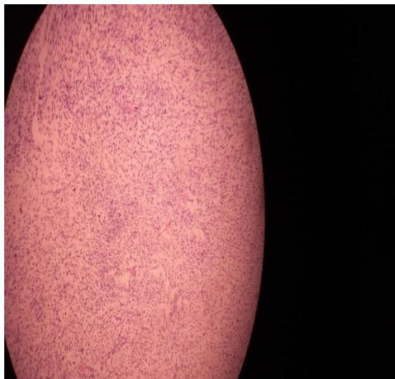
Fig. 4. Tejido estromal con presencia de ductos mamarios en la porción central.

La paciente evolucionó favorablemente durante el posoperatorio. A los 8 días de apirexia se le dio alta con buen estado general.