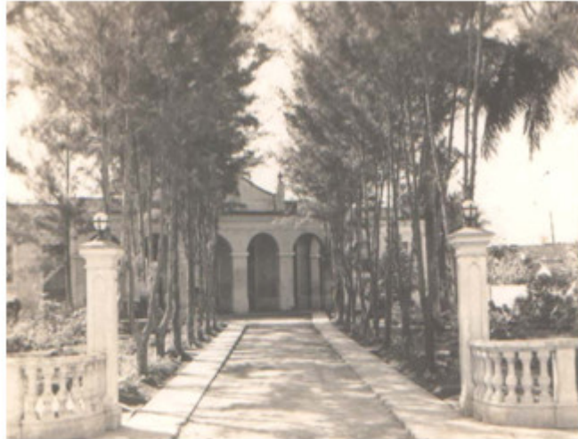
Cárcel de Colón, 1865.