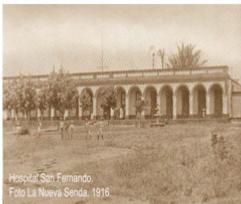
Hospital San Fernando. 1916.