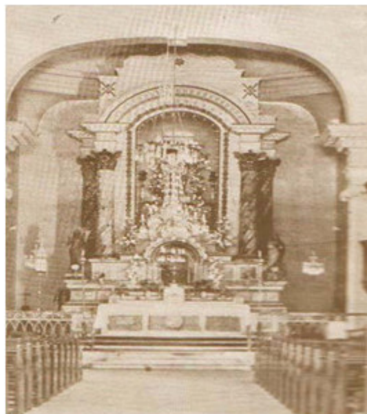
Altar mayor de la Iglesia Católica de Colón