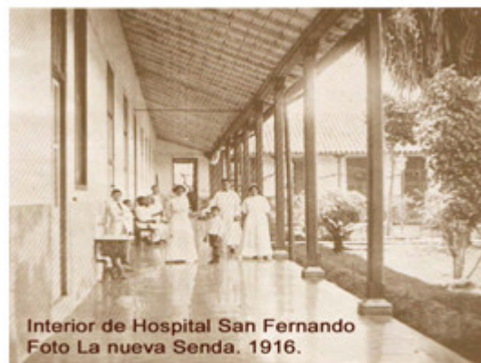
Interior de Hospital San Fernando 1916.