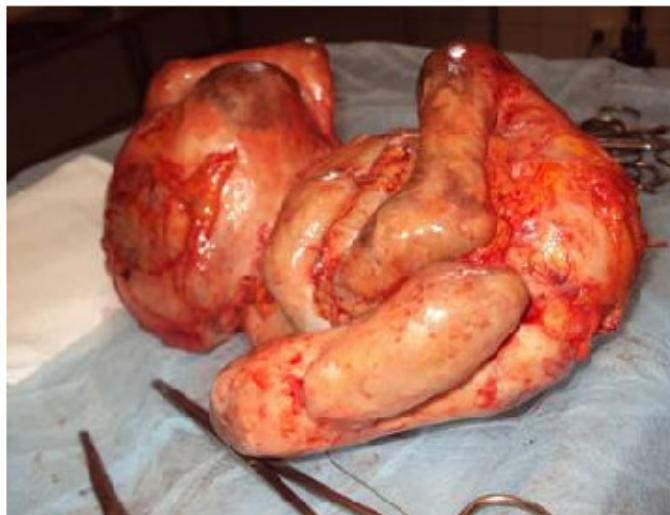
Fig. 2. Litopedion, peso 1 880g, después de la exéresis.

La paciente continuó su seguimiento en el servicio de atención prenatal del Hospital General de Bengo, con seguimiento especializado y por ultrasonografía, presentando posteriormente un parto eutócico con un recién nacido femenino con buen peso y Apgar 9/9 a las 39 semanas de gestación.