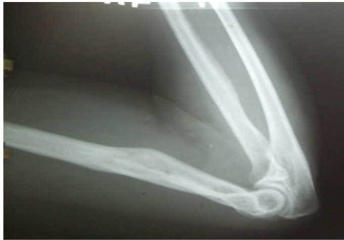
Fig. 4. Rx lateral consolidado.

Una vez retirada la inmovilización, se inicia el proceso de rehabilitación, inicialmente en el hogar (hidromasaje) y ejercicios pasivos, y luego se le añade fisioterapia convencional durante 4 semanas en total, lográndose una recuperación del 100 % de sus funciones a las 16 semanas, realizándose RX control final, vista AP y lateral en esta fecha. (Fig.4 y 5).