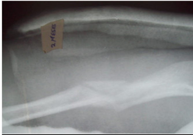
Fig. 3. Rx lateral. 8 semanas.

Se realiza Rx control mensualmente hasta completar 10 semanas, donde se observaron signos de consolidación ósea, clínicamente no hay dolor, ni movilidad anormal. (Fig. 3)