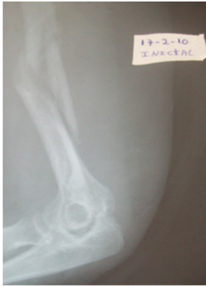
Fig. 1. Rx lateral inicial sin yeso.