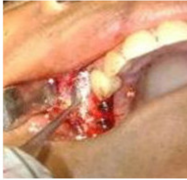
Fig.6. Colocación del material de relleno.