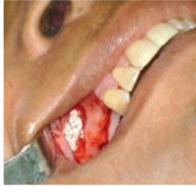
Fig.3. Desplazamiento de la ventana ósea.