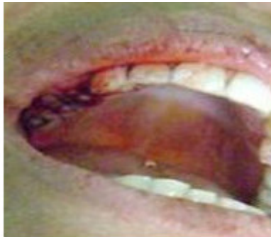
Fig.7. Sutura del colgajo.