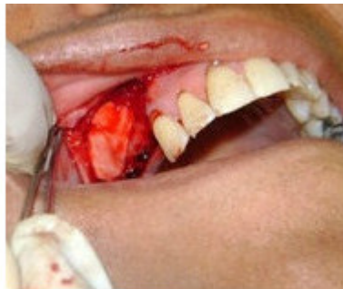
Fig.5. Aislamiento de la cavidad quirúrgica.

Se aislará la cavidad quirúrgica por medio de una membrana barrera, que excluya las células del compartimento conectivo procedente del colgajo y ayudan a la contención del material de relleno. (Fig. 5)