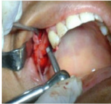
Fig.4. Colocación de los implantes.

Se aislará la cavidad quirúrgica por medio de una membrana barrera, que excluya las células del compartimento conectivo procedente del colgajo y ayudan a la contención del material de relleno. (Fig. 5)