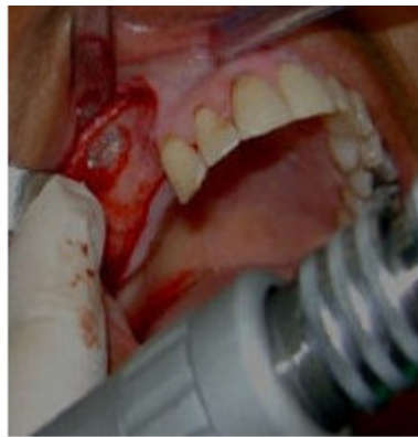
Fig. 2. Ventana quirúrgica.

Una vez que se insinúa la membrana sinusal a través de la osteotomía, se procede a fracturar hacia adentro la "ventana quirúrgica" de forma que su arista superior actúe como una bisagra, trasladando hacia apical el nuevo suelo del seno maxilar. Durante este delicado procedimiento hay que procurar no perforar la membrana de Schneider, que se debe ir despegando lentamente mediante instrumentos especialmente diseñados para este propósito, para que así acompañe a la ventana ósea y quede incluida en el espacio de la nueva configuración del seno maxilar. (Fig. 2)