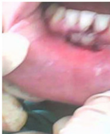
Fig.4. Colocación del injerto en el lecho receptor