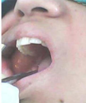
Fig.3. Exéresis de capuchón pericoronario