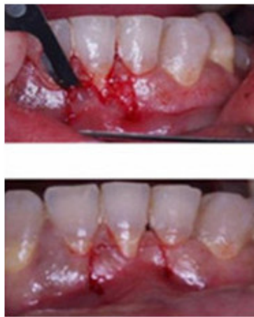
Fig.1. Incisiones verticales y horizontales en lecho receptor