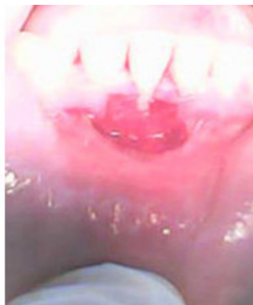
Fig.2. Lecho receptor preparado