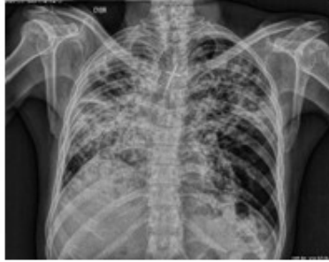
Fig. 2. Lesiones radiopacas.