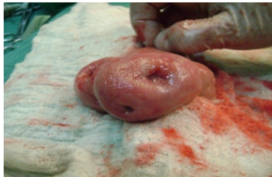
Fig. 2. Foto de la pieza quirúrgica.

Durante la cirugía se constató la lesión tumoral gástrica descrita en los estudios imagenológicos y endoscópico, sin adenopatías visibles ni palpables, no metástasis, ni infiltraciones a órganos vecinos. (Fig. 2).