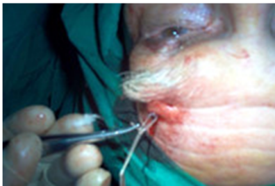
Fig. 3. Cirugía correctiva de ptosis.