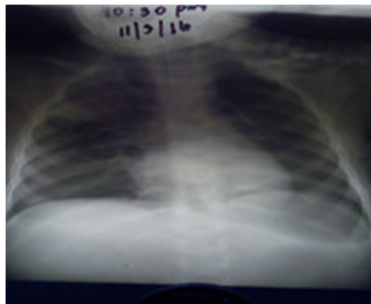
Fig. 3. Reinsuflación del pulmón izquierdo.

Se continuó con la fisioterapia respiratoria, lavados bronquiales, además de aspiración endotraqueal. A las 10.30 pm de la noche se repitió la radiografía de tórax, reflejó el pulmón izquierdo completamente reexpandido. (Fig. 3)