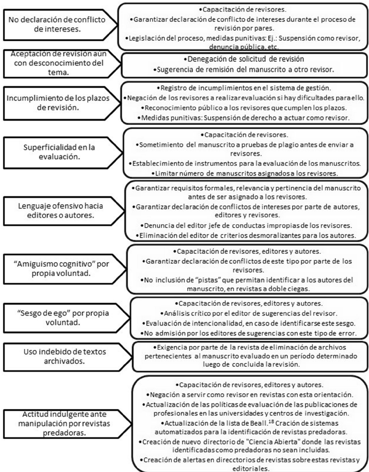
Fig. 1. Propuestas para la prevención y control de sesgos relacionados con faltas éticas.