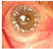
Fig. 1. Evaluación fue satisfactoria, después de cirugía.