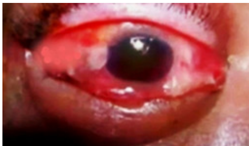
Fig. 1. Edema palpebral, quemosis, cámara anterior estrecha.

Motilidad ocular: sin alteraciones en ambos ojos.