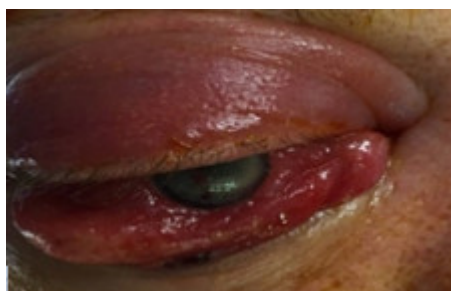
Fig. 2. Aumento de volumen de zona periorbitaria y párpados.

Movimientos oculares: limitación de los movimientos del recto superior, lateral y medial.