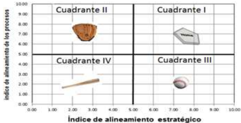
Fig. 1. Matriz de alineamiento estratégico.

La matriz de alineamiento estratégico es construida con el Iae y el Ipr. Se define una tabla de doble entrada (fig. 1), donde se establece una línea de demarcación sobre cada eje, de manera que se obtiene una matriz de cuatro cuadrantes. (15)