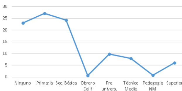
Figura 3. Nivel de escolaridad de las personas de 60 años y más en los municipios estudiados