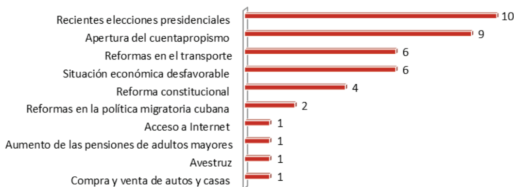
Figura 4. Cambios actuales en la vida cotidiana cubana

Se exploran las percepciones sobre los cambios actuales en la vida cotidiana cubana, en aras de identificar si hay un lugar asignado a las restricciones de la política migratoria de Estados Unidos hacia Cuba. De manera abierta y espontánea, los sujetos expresan lo que consideran relevante para sus vidas en Cuba. En la figura 4 aparecen los acontecimientos identificados por los sujetos en el área social.