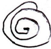
Figura 3. Simbolización de la política migratoria en la figura de Trump

Las evidencias de la representación gráfica oral antes mencionadas, en su mayoría están asociadas a Trump. Y hay otros dos sujetos que específicamente simbolizan con el dibujo de la figura 3 el egocentrismo de esta política en el propio Trump, porque lo que me viene a la mente es él, bien grande pisoteando a un latino que es más pequeño que él.