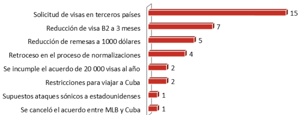
Figura 1. Frecuencia de conocimientos referidos sobre la política migratoria de Trump hacia Cuba