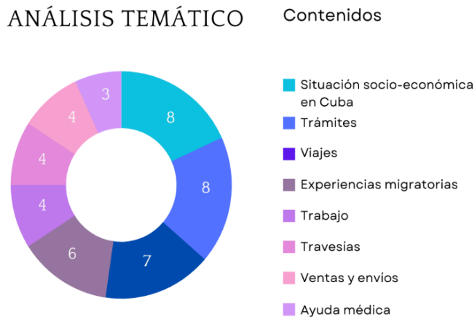
Figura 1. Análisis temático