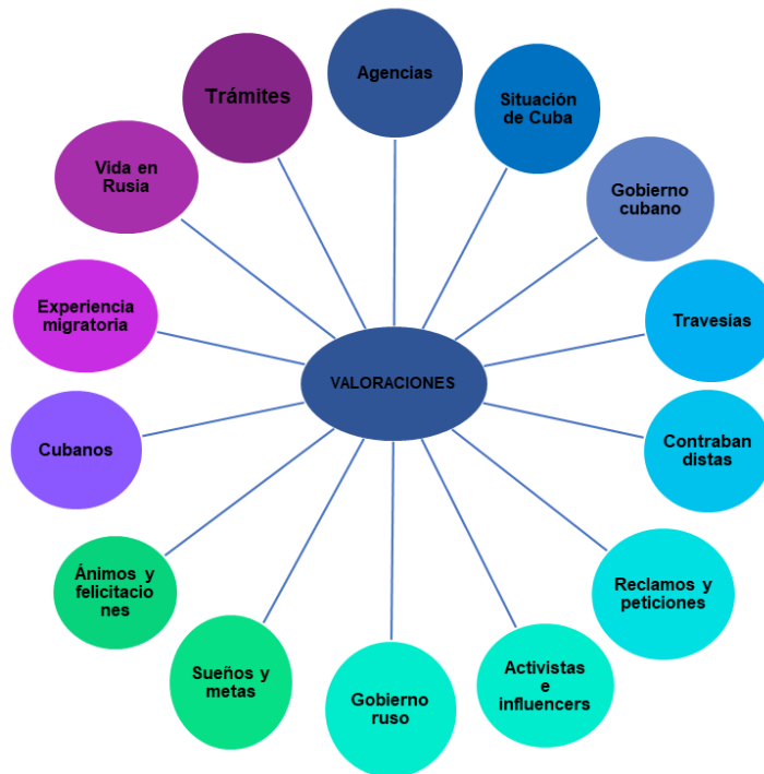
Figura 2. Análisis estructural

Los matices emocionales en los contenidos identificados son igualmente importantes en este análisis, pues expresan cómo son vivenciados estos procesos y cómo son llevados al espacio digital, donde toman otras características debido a su alcance y capacidad de contagio emocional (figura 2).