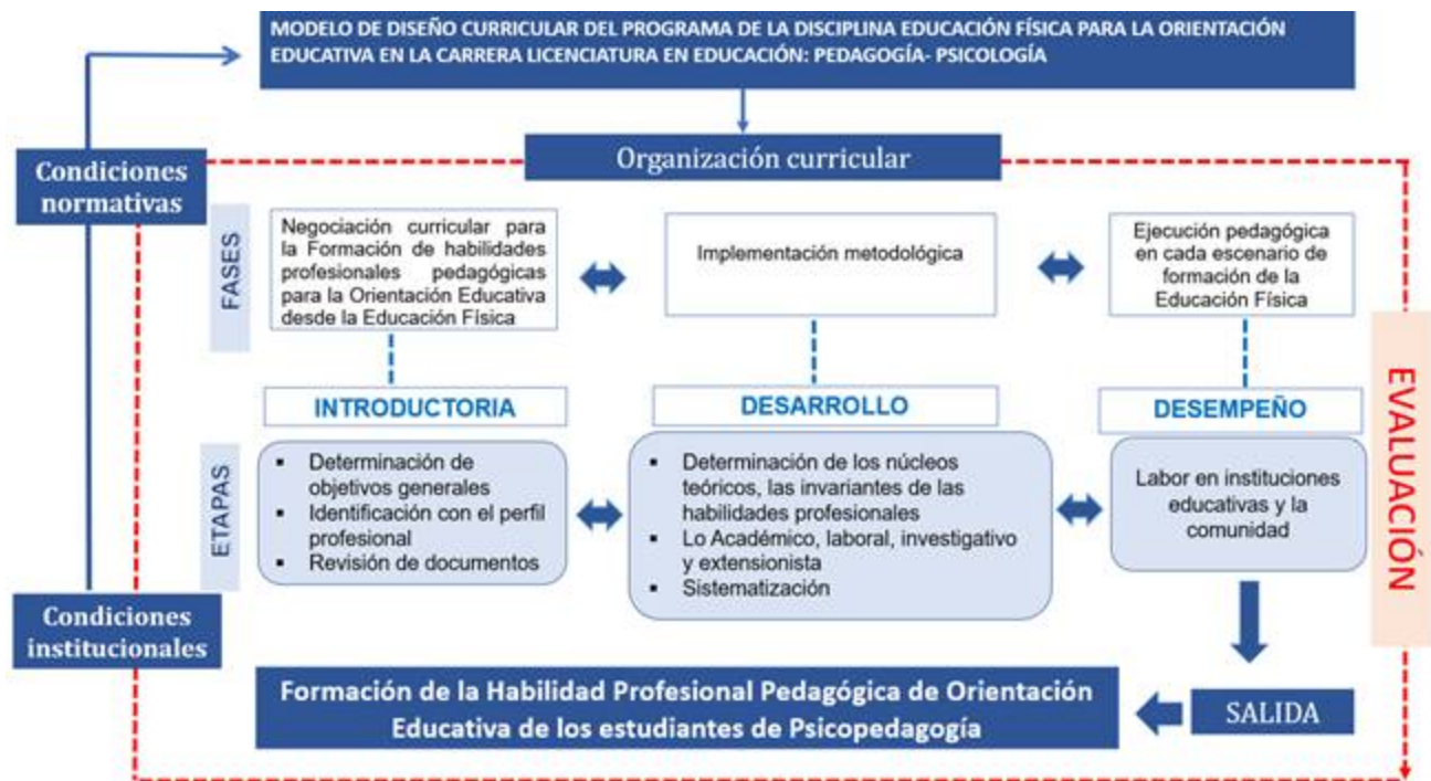
Figura 1. Representación del modelo de diseño curricular propuesto.

La representación gráfica del modelo propuesto para la formación de la habilidad profesional pedagógica de orientación educativa desde la Disciplina Educación Física en los estudiantes de Pedagogía-Psicología, se muestra en la (Figura 1). En el mismo se destacan tres partes fundamentales: Condiciones de entrada, Organización curricular, y la Salida o resultados esperados. En cuanto a las fases involucradas (Introdutoria, Desarrollo y Desempeño), cada una está interrelacionada con su etapa correspondiente y sus acciones específicas. Las etapas se caracterizan por su carácter instructivo, educativo y desarrollador.